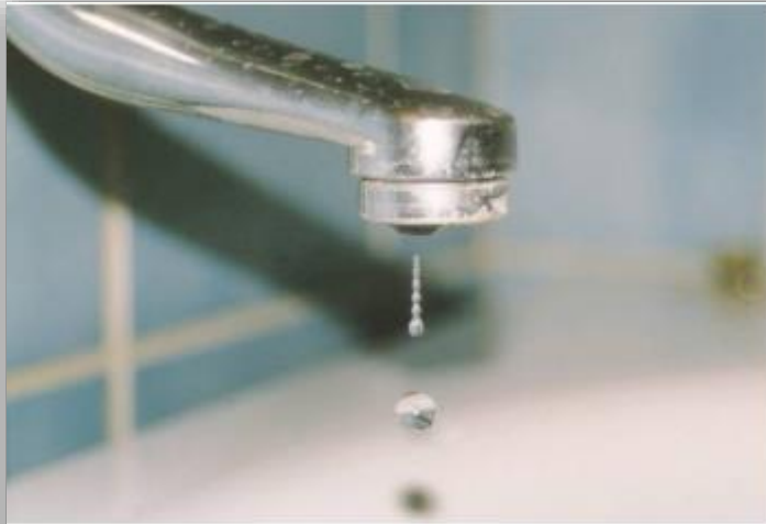
Seluruh kawasan Seremban dan sebahagian besar kawasan di Jelebu akan mengalami gangguan bekalan air selama 24 jam mulai pukul 8.00 pagi, Selasa depan. -Gambar hiasan

SEREMBAN: Seluruh kawasan Seremban dan sebahagian besar kawasan di Jelebu akan mengalami gangguan bekalan air selama 24 jam mulai pukul 8.00 pagi, Selasa depan.